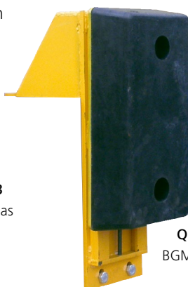
Q10-3067 BGM5010 Haut