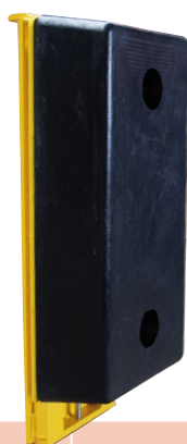
Q10-3043 BGM5010 Bas

Le BGM 5010 est un butoir mobile en caoutchouc ( matériau exclusif ).