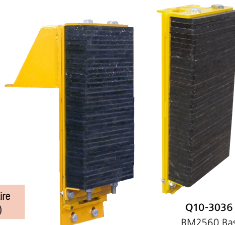
Q10-3035 BM2560 Haut